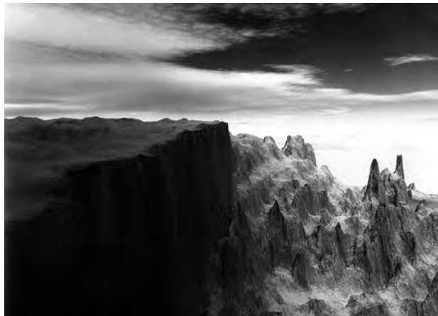
Figura 05: Joan Fontcuberta: Orogenesis: Watkins , 2004.