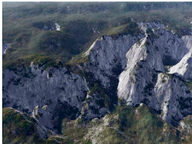
Figura 02: Joan Fontcuberta: Orogenesis: Cézanne , 2003.