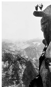
George Fiske: Yosemite Park , ca. 1885 The Yosemite Museum Yosemite National Park