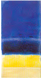
Mark Rothko: Untitled , 1950 Private Collection