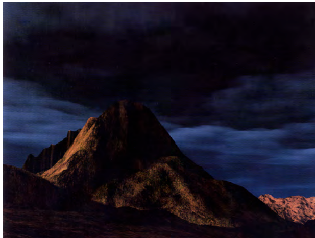
Figura 04: Joan Fontcuberta: Orogenesis: Rothko , 2004.