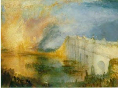
Joseph Mallord William Turner: The Burning of the Houses of Lords and Commons, 16 th October 1834, 1835 Philadelphia Museum of Art