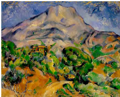
Paul Cézanne: Mont Sainte-Victoire , 1900 State Hermitage Museum, St. Petersburg, Russia