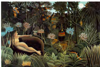
Henri Rousseau: The Dream , 1910 Museum of Modern Art New York