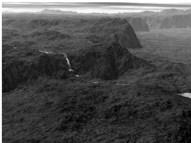
Figura 06: Joan Fontcuberta: Orogenesis: Fiske , 2004