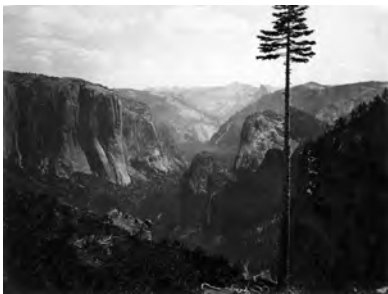
Carleton E. Watkins: Yosemite Valley , ca. 1865 J. Paul Getty Museum Los Angeles